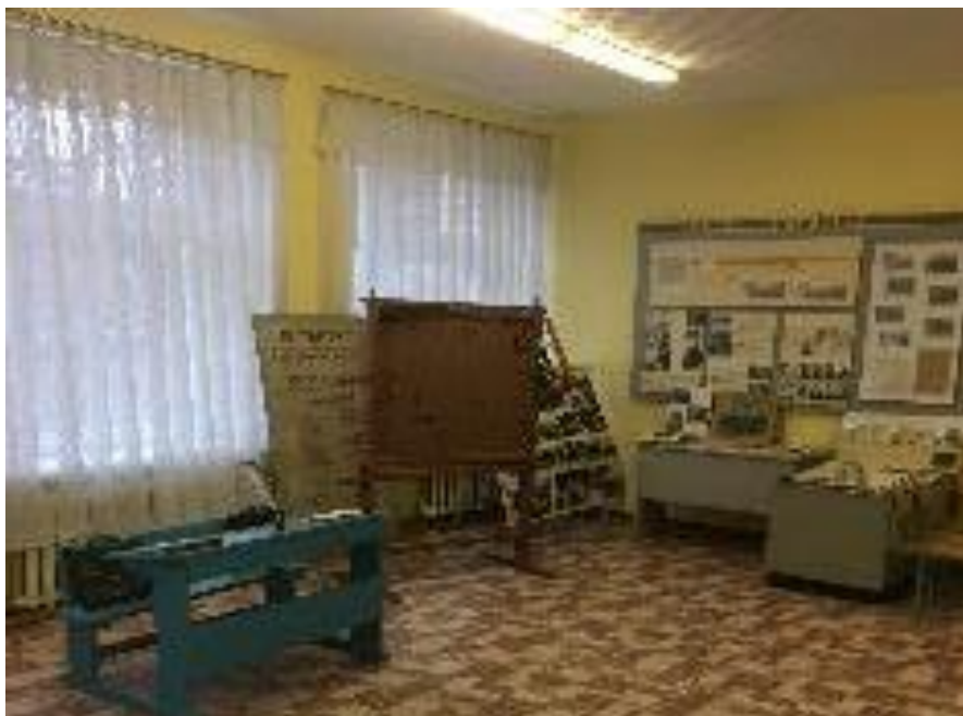
8. Кабинет педагога – психолога – 13 кв. м.