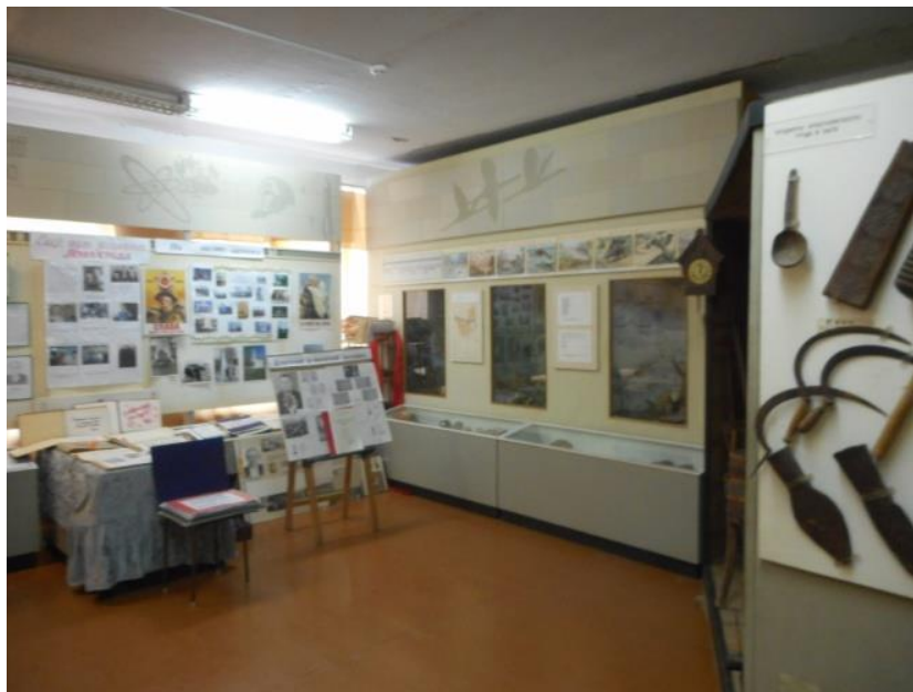
2 зал (открыт 18 мая 2018г) – 52 кв.м